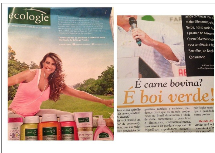
Figura 2: Revista Caras edição 1083 de agosto de 2014 e AG Revista do criador no 181, Editora Centauros, Edição de outubro de 2014

Embora seja perceptível que revistas deste segmento dispõe de uma série de propagandas relacionadas à algum apelo ambiental, foram encontrados sempre, mais de dezesseis imagens publicitárias, pelas quais a questão ambiental aparece de alguma maneira sendo citada. A Figura 2 foi montada com duas propagandas; na esquerda da “Revista Caras” e na direita da “Revista AG Revista do criador”, para demonstrar que esse tipo de apelo acaba sendo verificado em meios de comunicação que atingem diferentes públicos. Ou seja, a captura é pulverizada: