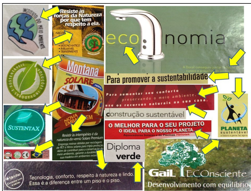
Figura 1: Fragmentos de algumas imagens da Revista Arquitetura e Construção, Editora Abril, Edição de Abril de 2008

Para tentar abarcar as referências de expressão, atenta-se a alguns estímulos baseados nas matrizes discursivas, as quais representam a ideia de cuidado ambiental corrente, como um movimento de criação para o texto. Neste sentido, destaca-se alguns artifícios de captura, os quais utilizando a temática ambiental, produzem atrativos que capitalizam o consumo, conforme Figura 1: