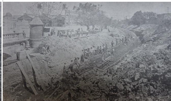
Ilustración 1. Armadura de fierro del túnel