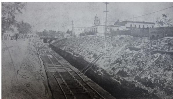
Ilustración 1. Base del túnel