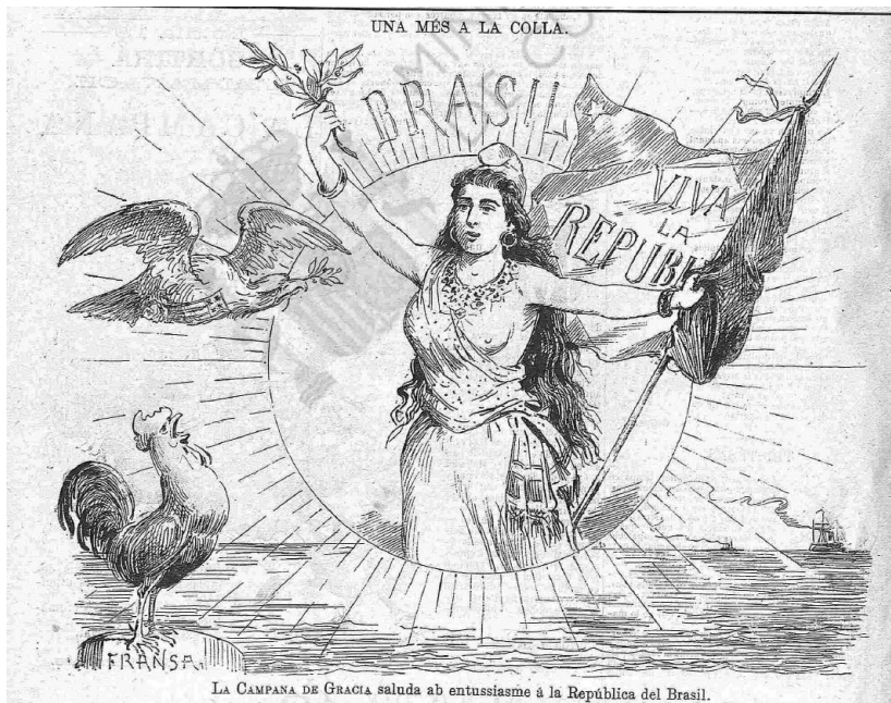
Campana de Gracia , 14 dez. 1889