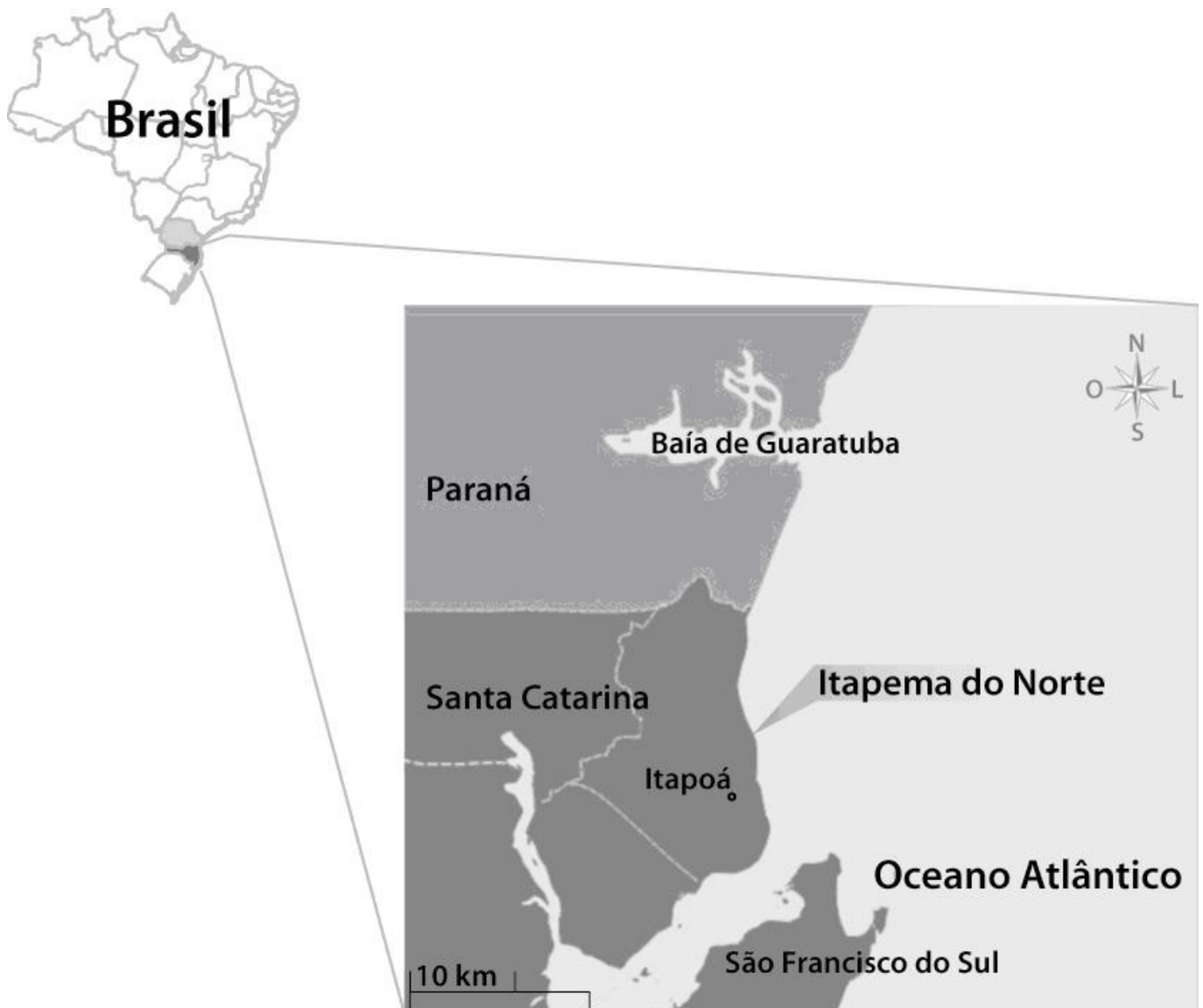
Figura 1 – Localização da comunidade de Itapema do Norte no litoral norte de Santa Catarina, Brasil.

metros) utilizando redes com pranchas ou portas e malha de 2 cm entre nós opostos do ensacador. As pescarias são de caráter sol-a-sol, isto é, os pescadores partem na aurora e retornam no mesmo dia. A amostra do mês constou do conjunto de peixes capturados no último arrasto efetuado no dia. Os peixes – total de 20197 – foram acondicionados em isopor com gelo e transportados para laboratório, sendo identificados e mensurados (comprimento total - CT e peso total - PT) (Tabela 1).