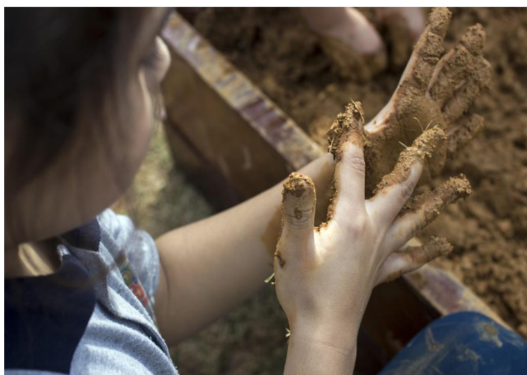
Foto 2: CEI Profª Herondina da Silva Vieira, jun/2018, Joinville-SC

Essa foi uma das primeiras imagens que fiz. E me pego recordando que efeitos eu imaginei produzir, no sentido de inscrever uma noção de espaço sustentável, endereçando-a para um trabalho do campo da educação ambiental. Obviamente, fiz questão de registrar a estudante enquanto brincava com materiais “da natureza”, mostrando sua presença no bosque localizado no terreno do próprio CEI, posando espontaneamente, com outras crianças brincando ao fundo. Enquadrei tudo que eu acreditei ser ideal para referenciar a minha ideia: o tronco superior da minha protagonista, que olha diretamente para a lente, à esquerda do quadro, quase descolada do fundo e próxima de quem “vê” a foto. Quase como um cumprimento de boas vindas ao seu universo, o universo escolar que eu produzi para ela neste quadro. Tal construção discursiva, em imagem, contou com a luz do sol para dar o tom dourado à fotografia, remetendo à felicidade, vida saudável, vida feliz, entre outros adjetivos que compõem uma determinada noção de beleza. Acredito que minha intencionalidade estava na mensagem circunscrita em uma estética da felicidade: “as crianças são mais felizes estudando em ambientes assim”.