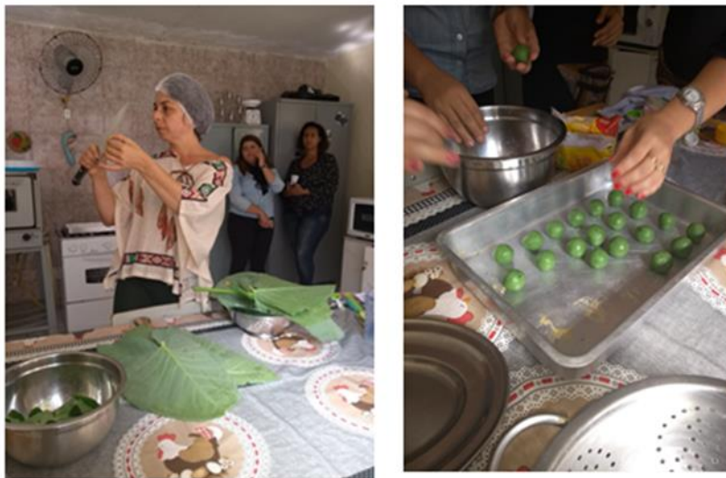
Figura 2. Fotos que muestran cómo hacer recetas con PANC.

El tema de las PANC se desarrolló en la escuela Maria das Dores una de las escuelas con huerto vinculada al proyecto, lo que permitió hacer el reconocimiento de las PANC in situ , en su mayoría desconocidas por los participantes de la actividad formativa. También ese día se confeccionaron recetas con PANC recogidas en el huerto de la escuela como se muestra en la figura no.2. En ese encuentro se promovió la reflexión sobre el impacto que causan nuestros hábitos alimenticios en la biodiversidad y nuestra calidad de vida.